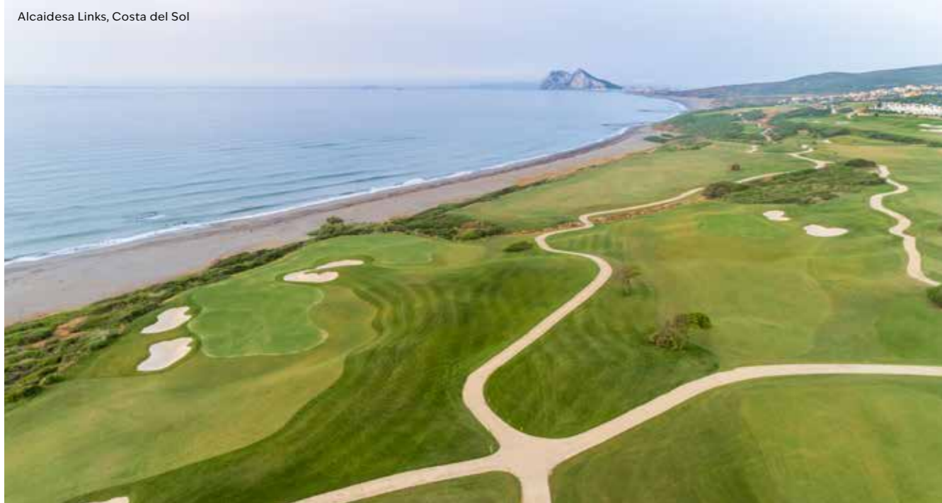
Alcaidesa Links, Costa del Sol