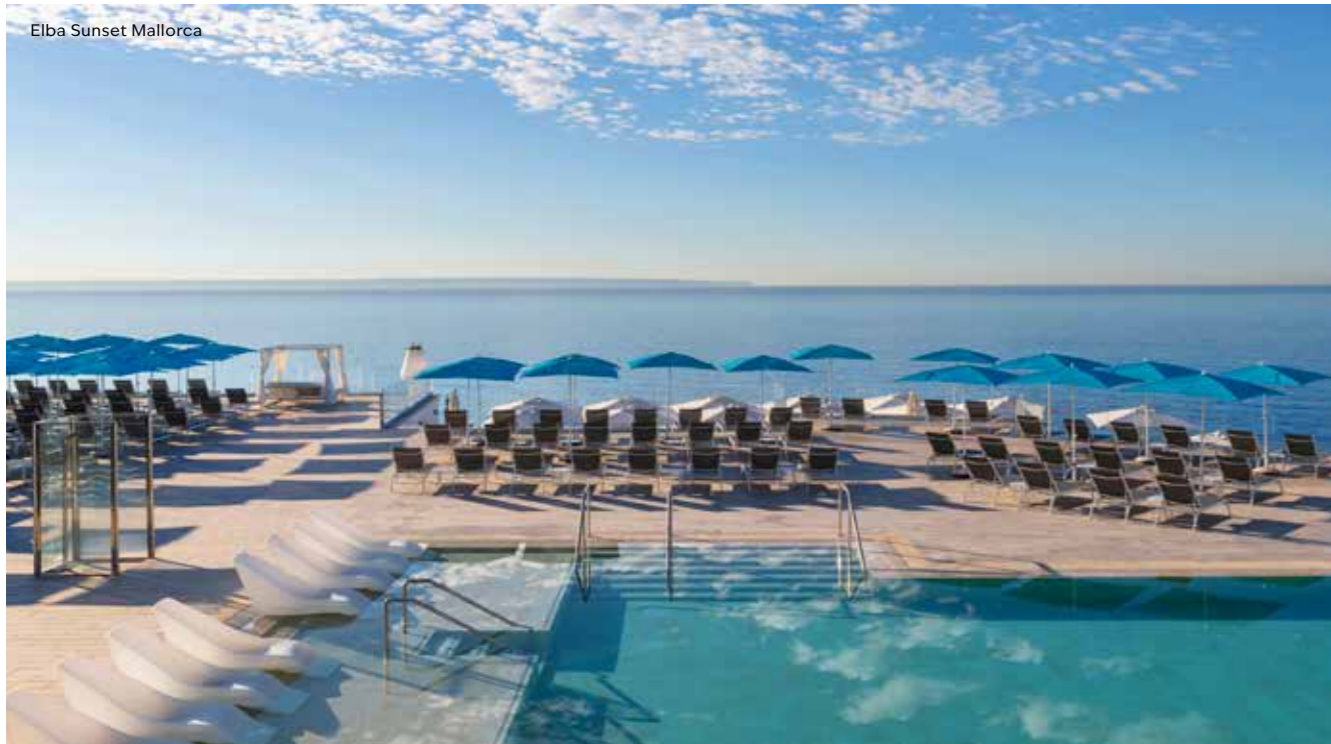
Elba Sunset Mallorca